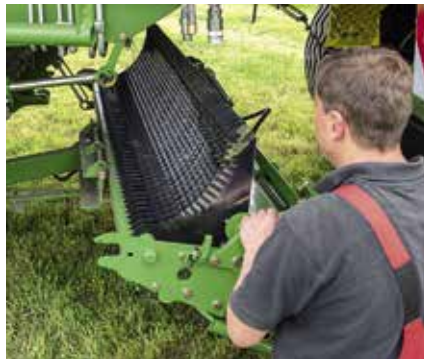
Nach Entkoppeln eines Zylinders (mit einfachem Splint) kann der gesamte Messerbalken mit 48 Messern ausgeschwenkt...

Das ermöglicht der Antrieb mit einem Verbundriemen: Mit voller Drehzahl wird die Kraft mittels des sechsrilligen Riemens, der per Feder gespannt wird, auf ein Planetengetriebe übertragen. Das ist im Rotorgehäuse untergebracht und reduziert die Drehzahl von 1200 U/min auf 52 U/min. Wir haben während des gesamten Tests lange nach dem Ansprechen der Überlastsicherung gesucht. Selbst künstlich zusammengeschobene Grasberge schluckte der ZX. Der Riemenantrieb bricht Lastspitzen, so dass das Auslösen der Überlastsicherung verhindert wird.