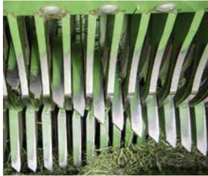
Die Rotorzinken sind 22 mm breit. Die Form wurde für einen besseren Scherenschnitt entlang der Messer angepasst.

Der Messerbalken wird seitlich ausgeschwenkt, nachdem ein Zylinder des Messerbalkens entriegelt ist. Danach kann die Schleifwelle mit 24 Fächerscheiben über den Messerbalken geschwenkt werden, und mit einem Bügel werden die Messer zusätzlich stabilisiert. Mit 3000 U/min drücken sich die rotierenden Scheiben mit Kegelfedern an die Messerseite an. Die Schleifzyklen sind über das Bedienterminal einstellbar. Der Schleifwinkel ist mit 15° fix. Auf der gesamten Einheit sammelt sich aber ordentlich Dreck. Nur gut, dass ein Luftanschluss zum Abblasen installiert ist.