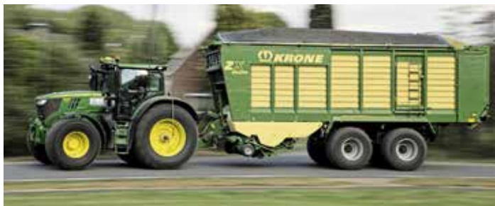
Die Ladungssicherung verhindert Materialverlust bis auf die hinteren 50 cm an der Heckklappe zuverlässig.