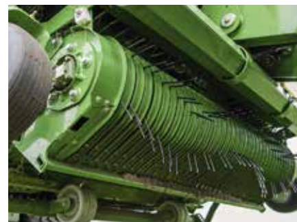
Eine automatische Drehzahlregelung der ungesteuerten Pickup gibt es auf Wunsch. Die Tastrollen hinter der Pickup dürften breiter sein.

Bereits beim Anbau fällt die 1¾-Zoll-Gelenkwelle (mit gutem Halter) auf. Bei unserem Praxistest haben wir mit Schleppern zwischen 300 und 360 PS