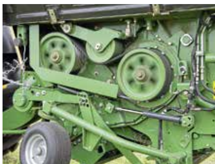
Von der BiG Pack übernommen: der Antrieb mit Verbundriemen und neuem Planetengetriebe im Rotorgehäuse.