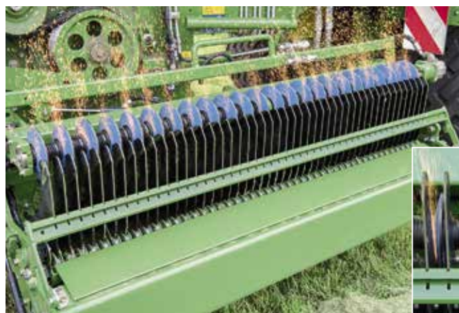
...und nach dem Schwenken der Schleifeinrichtung schnell geschärft werden.