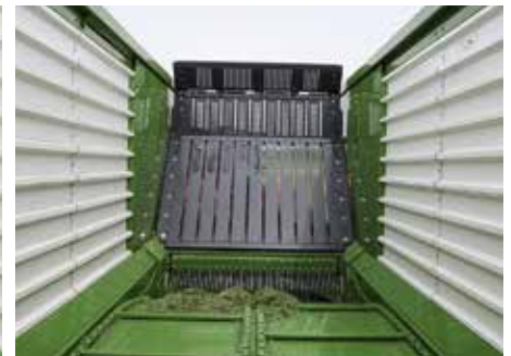
Die Stirnwand schwenkt um bis zu 100°. Damit wird der Wagen schneller leer. Und mit dem Einstellwinkel kann auf den Pressdruck im Wagen reagiert werden.