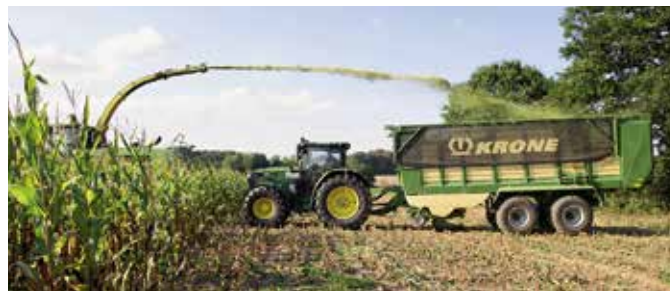
Mit abgesenkter Knickdeichsel und nach vorn gerichteter Stirnwand ist das Anhäckseln problemlos möglich.

zweimal in Folge. Das sollte für den Anwender programmierbar sein, denn nach unserer Erfahrung dürfte die Wand ruhig drei- oder viermal hin- und herschwenken, damit der Laderaum sauber geräumt ist.