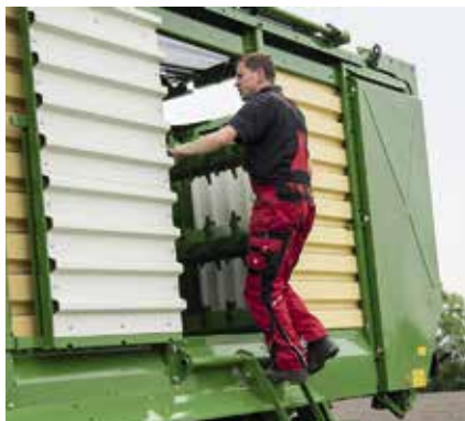
In 1,83 m Höhe beginnt der Laderaum, den man über die große Luke bequem erreicht.

Werfen wir einen Blick in den konischen Ganzstahlaufbau , der über 6 Stufen durch die große Tür in 1,83 m Höhe betreten werden kann. Vier Flachgliederketten mit einer Bruchlast von je 12 t sind ebenso geblieben wie der abgesenkte Kratzboden. Neu ist die bewegliche Stirnwand. Im Lademodus schwenkt die Wand automatisch in eine zuvor abgespeicherte Position (zwischen 50° und 85°). Krone hat diesen Wert in der Ladeautomatik begrenzt, so kann bei ganz nach hinten ausgeschwenkter Stirnwand (105°) nicht geladen werden, weil die Futterpressung und die Gefahr des Musens zu groß sind.